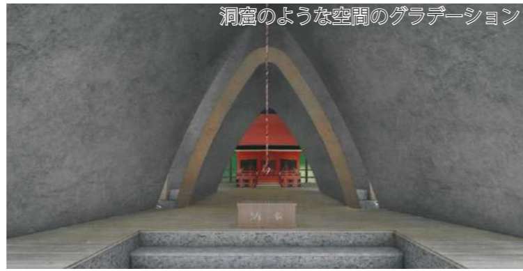
洞窟のような空間のグラデーション