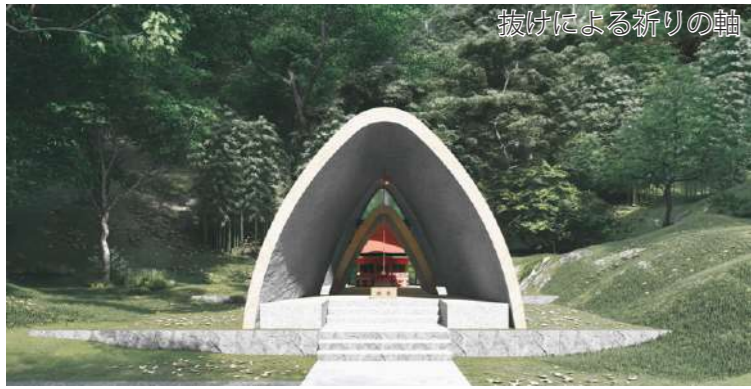
抜けによる祈りの軸